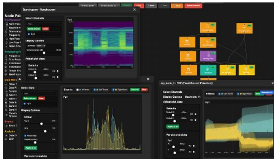
BMI-CA プラットフォーム解析画面

本プラットフォームはオープンソース化を見据え、商用センサ対応・リアルタイム処理・機械学習統合をさらに強化していきます。将来的には「インターネットのように誰もが利用可能なBMI基盤」として発展し、世界規模での共同研究・産業応用・新しい操作体験の社会実装を加速させることを目指しています。