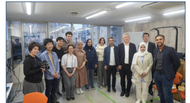
2025年5月日本でのサイトビジットの様子

Internet of Brains (IoB) は、ドバイ未来財団 (DFE) が運営するドバイ・フューチャー・ラボ (DFL) と連携し、人々が自身の脳波 (脳から発生する電気信号) や筋電位 (筋肉から発生する電気信号) を用いてロボットやアバターを自在に操る、次世代のブレイン・マシン・インターフェース (BMI) 技術の共同研究開発に着手しました。